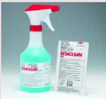
Аэрозоль 500 мл и салфетки 8 мл